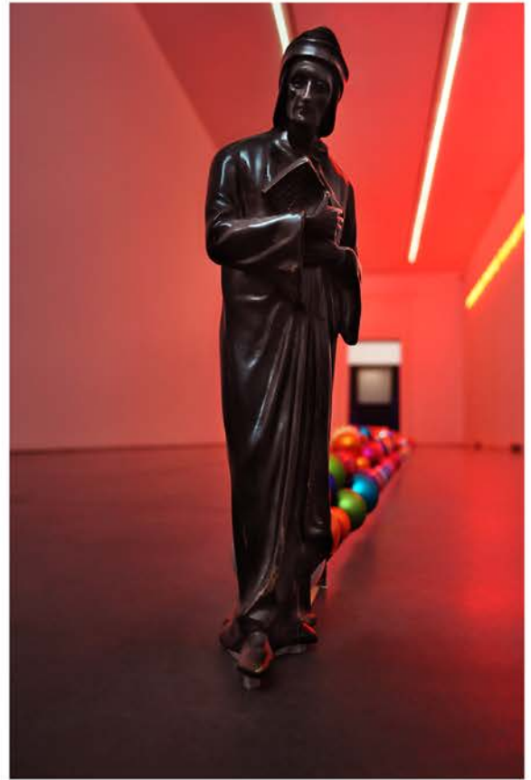
Alfredo Jaar, La Divina Commedia , 2016, particolare

of Napoli making direct reference to Dante's Divine Comedy. I also decided to celebrate Napoli, and pay homage to the immigrants who have transformed Napoli into what it is today. "Napoli, Napoli" is an installation in neon that spells the word Napoli in all the different languages of the most important immigrant communities of the city. "La Divina Commedia" is an installation where I suggest that Napoli is the perfect Dante landscape, and where we can find Inferno, Paradiso and Purgatorio. I completed a new, major permanent installation in Tasmania, at MONA, also titled "The Divine Comedy". It consists of three distinct pavilions. Regarding my relationship to Napoli, I love this city! I could live perfectly in Napoli, it offers the level of madness and chaos that I need, as well as an immeasurable magnitude of poetry and beauty".