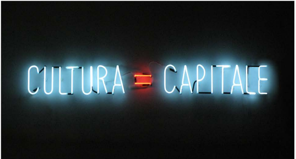
Alfredo Jaar, Cultura = Capitale , 2012

Fabrizio Tramontano: What did you mean by “politics of images” and the “ethics of representation” you referred to when you were assigned the Hasselblad prize for photography 2020?