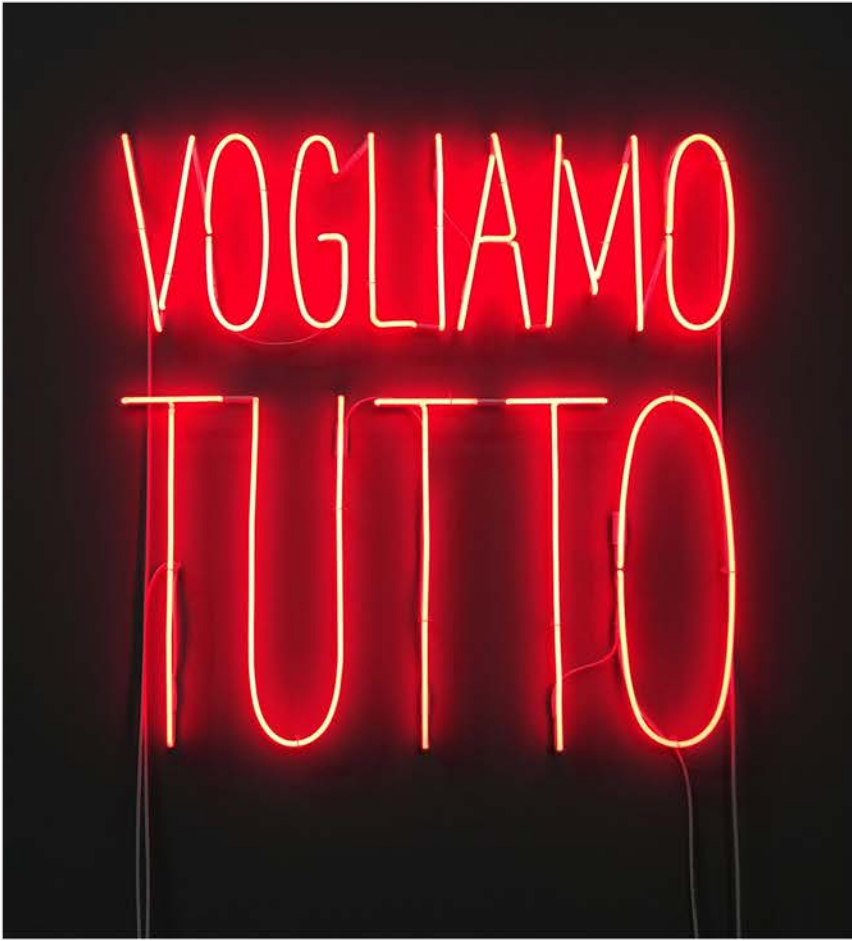
Alfredo Jaar, Vogliamo tutto, 2016