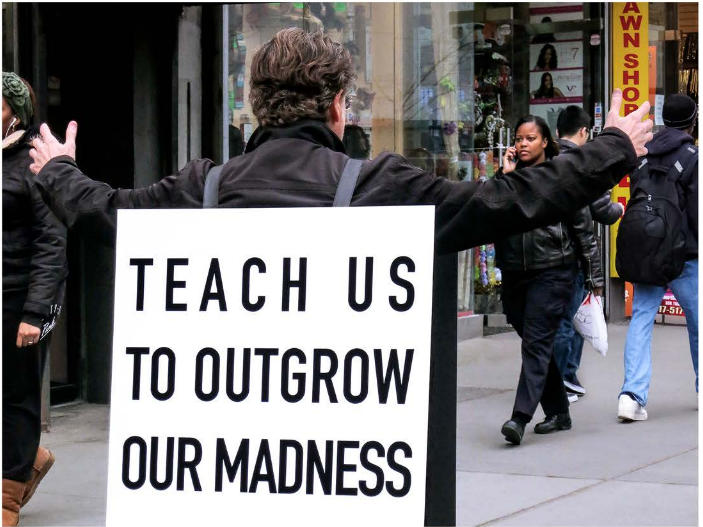
Alfredo Jaar, Teach Us to Outgrow Our Madness, 2018

“Alfredo Jaar affronta questioni di grande portata, testimoniando disastri umanitari e attestando l’impatto dei conflitti militari, della corruzione politica e della disuguaglianza economica in tutto il mondo”