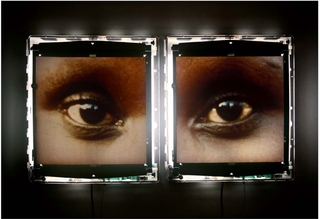
Alfredo Jaar, The Eyes of Gutete Emerita , 1996

in Cile. Fu un'influenza molto importante per la resistenza alla brutalità di Pinochet. È diventato un modello ed è stato attraverso i suoi scritti che ho scoperto la capacità della cultura di indurre il cambiamento. Poco dopo aver scoperto Gramsci, ancora in Cile, ho scoperto Pasolini. Avevo abbandonato gli studi di architettura e mi ero dedicato allo studio del cinema. Quello era il contesto in cui ho visto il mio primo film di Pasolini. Presto ho scoperto che era anche uno scrittore, un poeta, un critico, un polemista, qualcuno immensamente presente nella vita della società italiana ed europea. Molto presto nella mia carriera Pasolini è diventato per me il modello di intellettuale che volevo essere. Ora che sono confinato a casa, già da dieci settimane, sono tornato ai suoi scritti che raccolgo da molti anni. Ieri sera ho