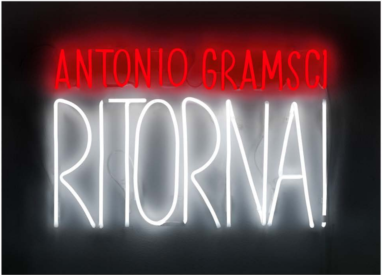
Alfredo Jaar, Antonio Gramsci, Ritorna! , 2015

Alfredo Jaar explores complex socio-political issues, bringing to the fore the ethics of representation. Through quiet and meditative works, Jaar confronts issues of great magnitude, bearing witness to humanitarian disasters and attesting to the impact of military conflict, political corruption and economic inequality throughout the world. His photographs, films, elaborate installations and community-based projects provocatively disturb common perceptions of reality. At the heart of his practice is what Jaar refers to as the politics of images, questioning the way we use and consume images, while pointing to the limitations of photography and the media to represent significant events. These are the motivations of the jury that awarded the artist the prestigious 2020 Hasselblad prize for photography. The central theme of his work is, therefore,