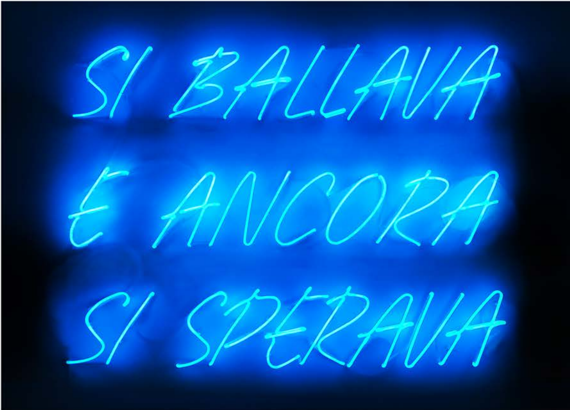
Alfredo Jaar, Si ballava e ancora si sperava , 2018 Courtesy Galleria Lia Rumma Milano/Napoli

work. Actually, I am probably the number one critic of my own work. I can't wait to start the next one! I have always considered all my works as exercises, and as failed exercises. Quoting Heiner Muller: they are "chosen mistakes". But, in spite of them being mistakes, I have chosen to make them. And I am still fond of quite a few of them. But I am incapable of selecting one for you".