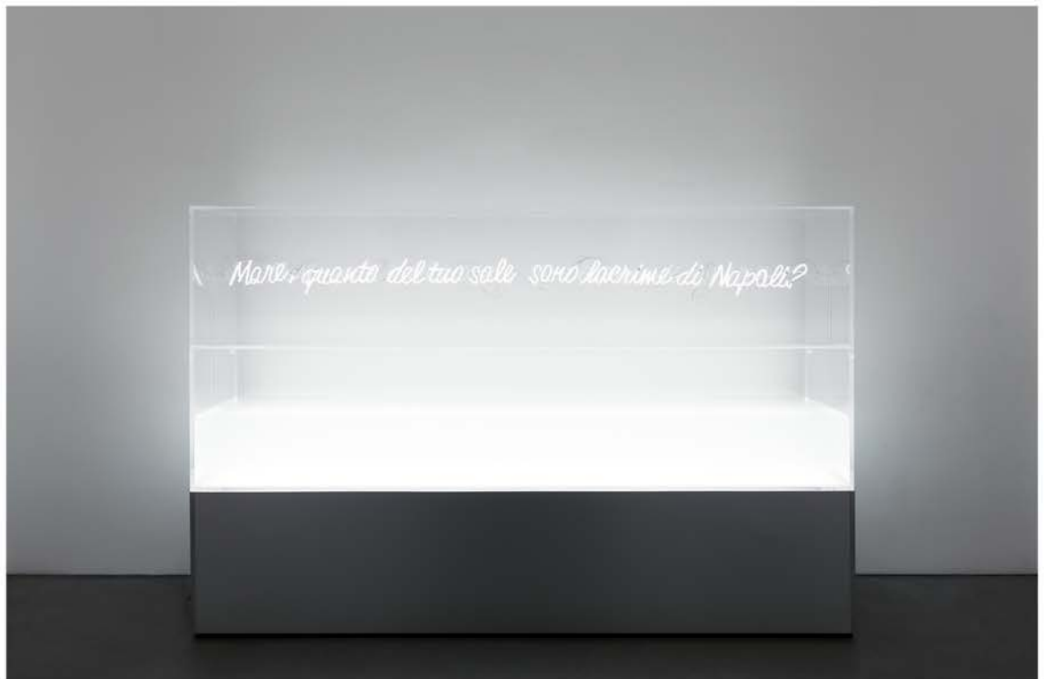
Alfredo Jaar, Mare, quanto del tuo sale sono lacrime di Napoli?, 2015

“When people ask me about my influences as an artist I always mention Gramsci and Pasolini. I feel that I have always worked in the shadow of Gramsci and Pasolini for many reasons. To be more precise I discovered Gramsci during the military dictatorship in Chile. He was a very important influence for the resistance to Pinochet’s brutality. He became a model. And it was through his writings that I discovered the capacity of culture to affect change. Shortly after my discovery of Gramsci, while still in Chile, I discovered Pasolini. I had abandoned my architectural studies and had begun studying filmmaking. That was the context in which I saw my first Pasolini film. Soon I discovered he was also a writer, a poet, a critic, a polemicist, someone who was immensely present in the life of Italian society and European society. Very