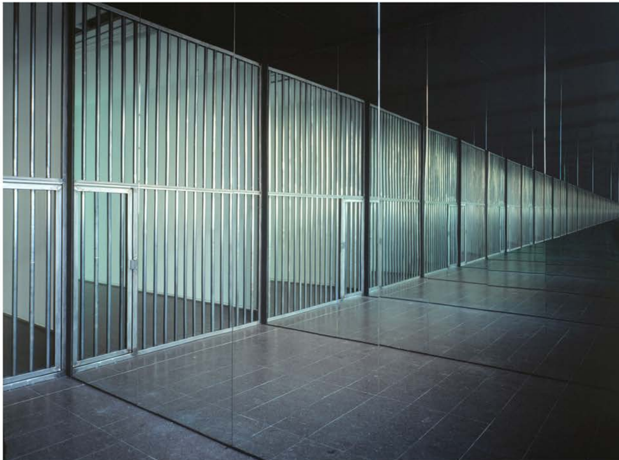
Alfredo Jaar, Infinite Cell , 2005 - Courtesy Galleria Lia Rumma Milano/Napoli

hanno trasformato questa città in quello che è oggi. “Napoli, Napoli” è un’installazione con neon che scrive la parola Napoli in tutte le diverse lingue delle più importanti comunità di immigrati della città. “La Divina Commedia” è un’installazione in cui suggerisco che Napoli è il perfetto paesaggio dantesco, dove possiamo trovare contemporaneamente Inferno, Paradiso e Purgatorio. Ho completato una nuova grande installazione permanente in Tasmania, al MONA Museum, intitolata anche questa “La Divina Commedia”. Si compone di tre padiglioni distinti. Per quanto riguarda il mio rapporto con Napoli, adoro la città! Potrei vivere benissimo a Napoli: offre il livello di follia e il caos di cui ho bisogno, oltre a una grandezza incommensurabile di poesia e di bellezza”.