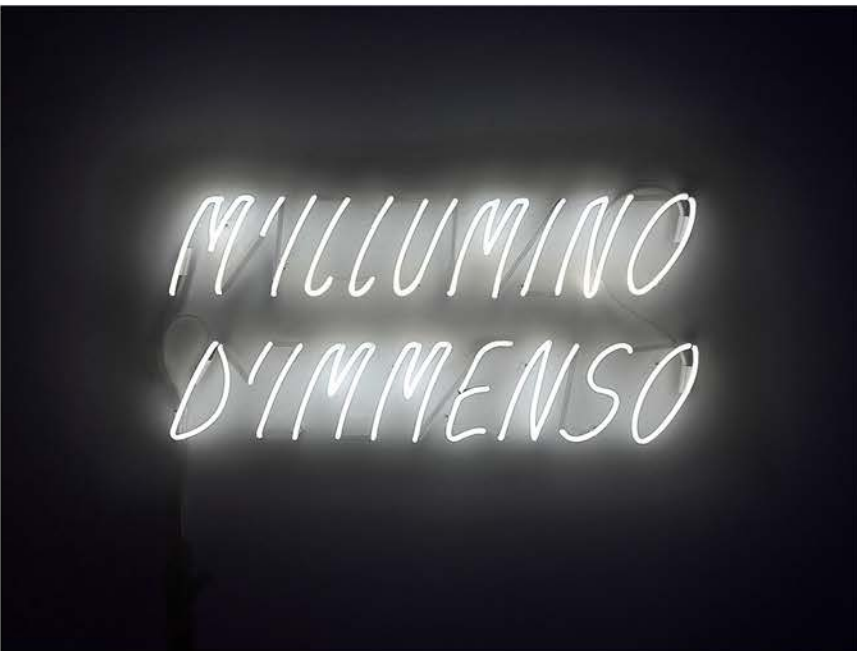
Alfredo Jaar, M'illumino d'immenso , 2009